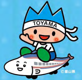
元氣とやまマスコット きととき君 新幹線開業PRマスコット ぷりと君